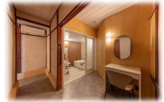
広い空間の脱衣所