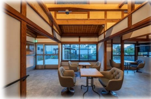
古民家カフェのような温かい空間